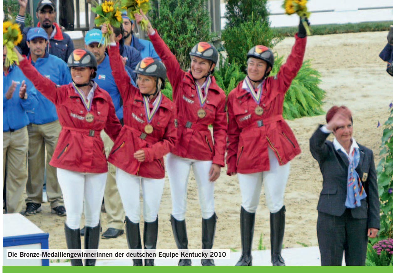
Die Bronze-Medaillengewinnerinnen der deutschen Equipe Kentucky 2010

Selbst wenn das Ausdauerrennpferd die gesamte Strecke absolviert hat, ist das Pferd-Reiter-