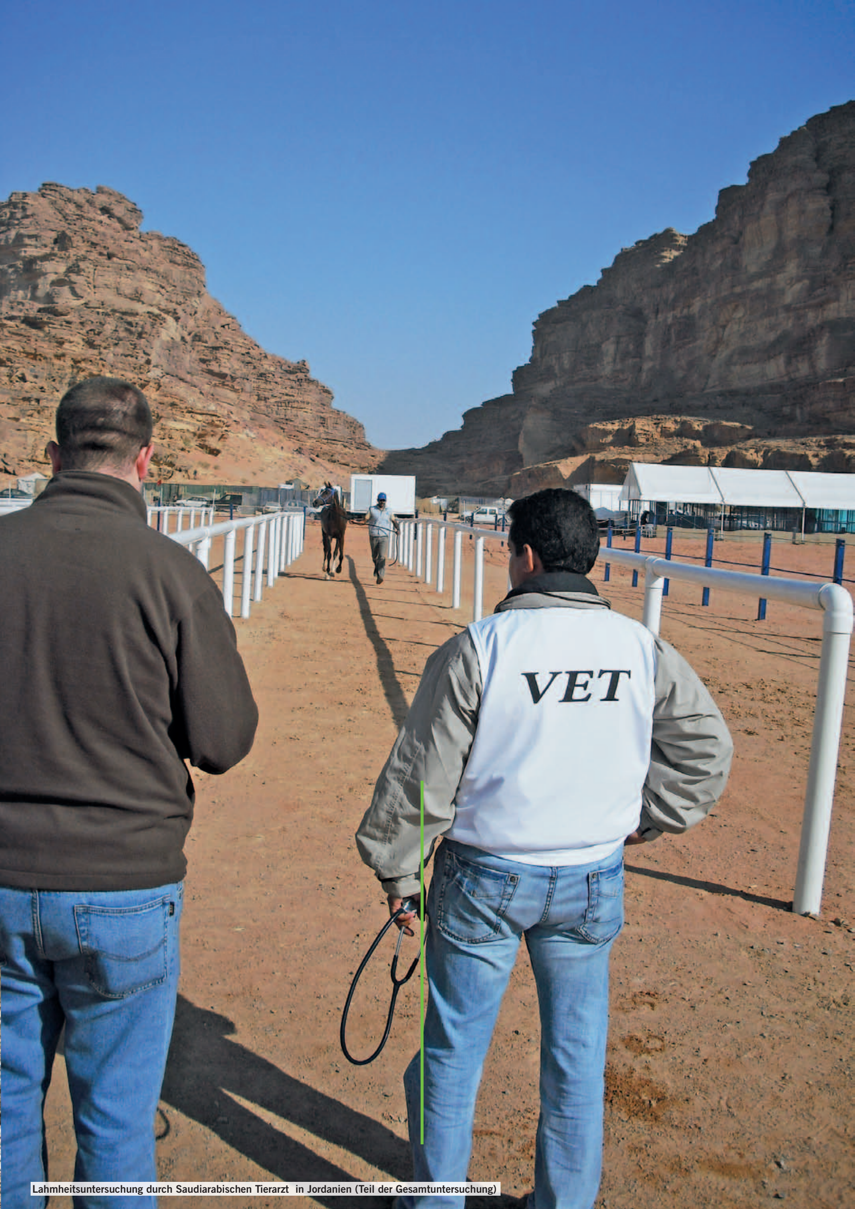
Lahmheitsuntersuchung durch Saudiarabischen Tierarzt in Jordanien (Teil der Gesamtuntersuchung)