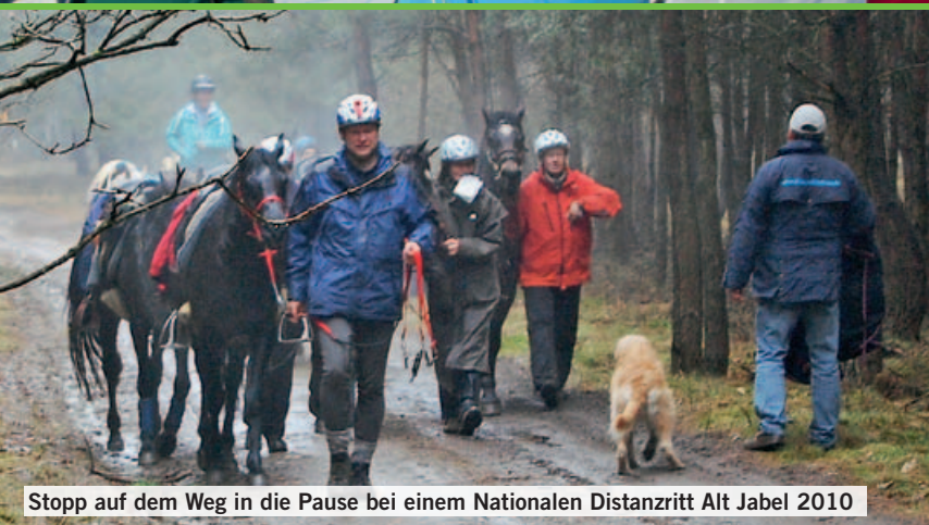
Stopp auf dem Weg in die Pause bei einem Nationalen Distanzritt Alt Jabel 2010