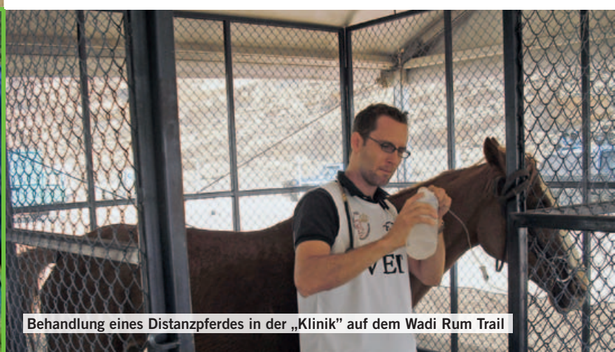
Behandlung eines Distanzpfers in der „Klinik“ auf dem Wadi Rum Trail