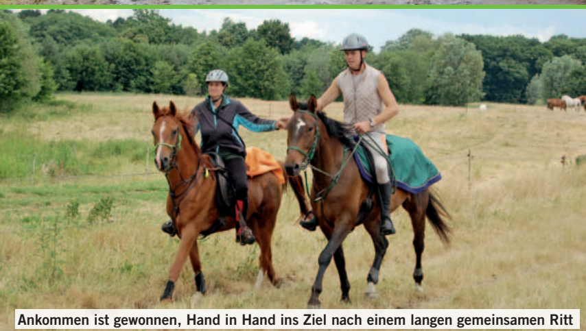
Ankommen ist gewonnen, Hand in Hand ins Ziel nach einem langen gemeinsamen Ritt