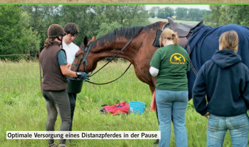
Optimale Versorgung eines Distanzpfers in der Pause