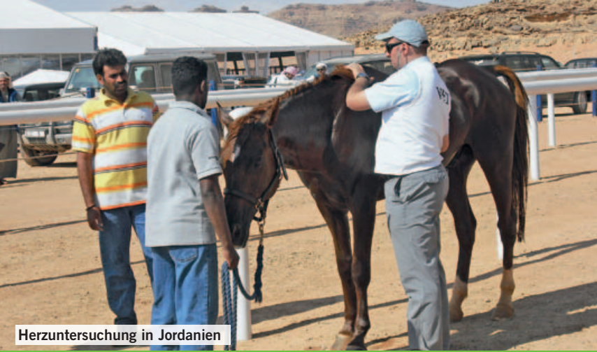
Herzuntersuchung in Jordanien